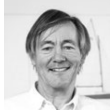
PASCAL CONQ Architect

“ Certains détails sont vraiment étonnants sur l’Oceanis 30.1, surtout si on pense à sa taille. La plate-forme arrière est grande et confortable. La forme du pont de chaque côté de la descente a été inclinée pour une meilleure utilisation des panneaux de pont ouvrants, tout en donnant un look élégant. Les espaces intérieurs sont remarquablement volumineux et hauts pour un 30 pieds, et lorsque vous entrez dans la salle d’eau, vous avez l’impression d’être sur un voilier beaucoup plus grand. L’éclairage indirect, avec le ruban lumineux de chaque côté du carré, crée une atmosphère élégante et accueillante à l’intérieur. ”