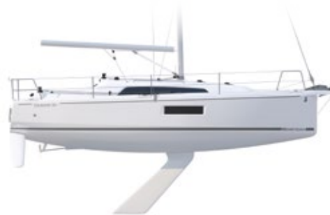
PROFILE Lifting keel version - Quille relevable