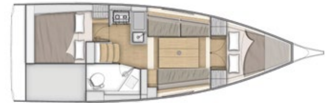
LOWER DECK 2 cabins + 1 head - 2 cabines + 1 salle d'eau